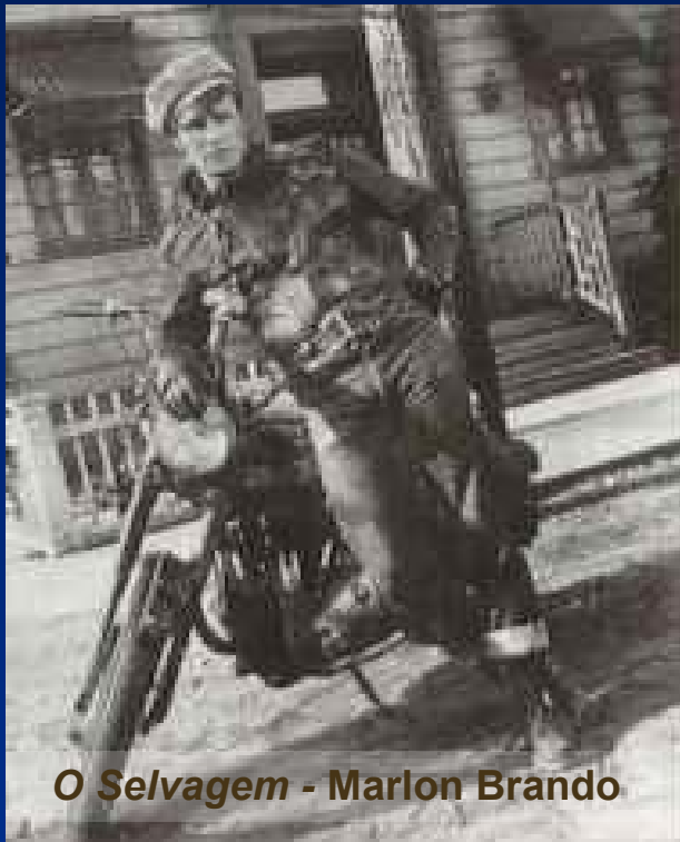
O Selvagem - Marlon Brando